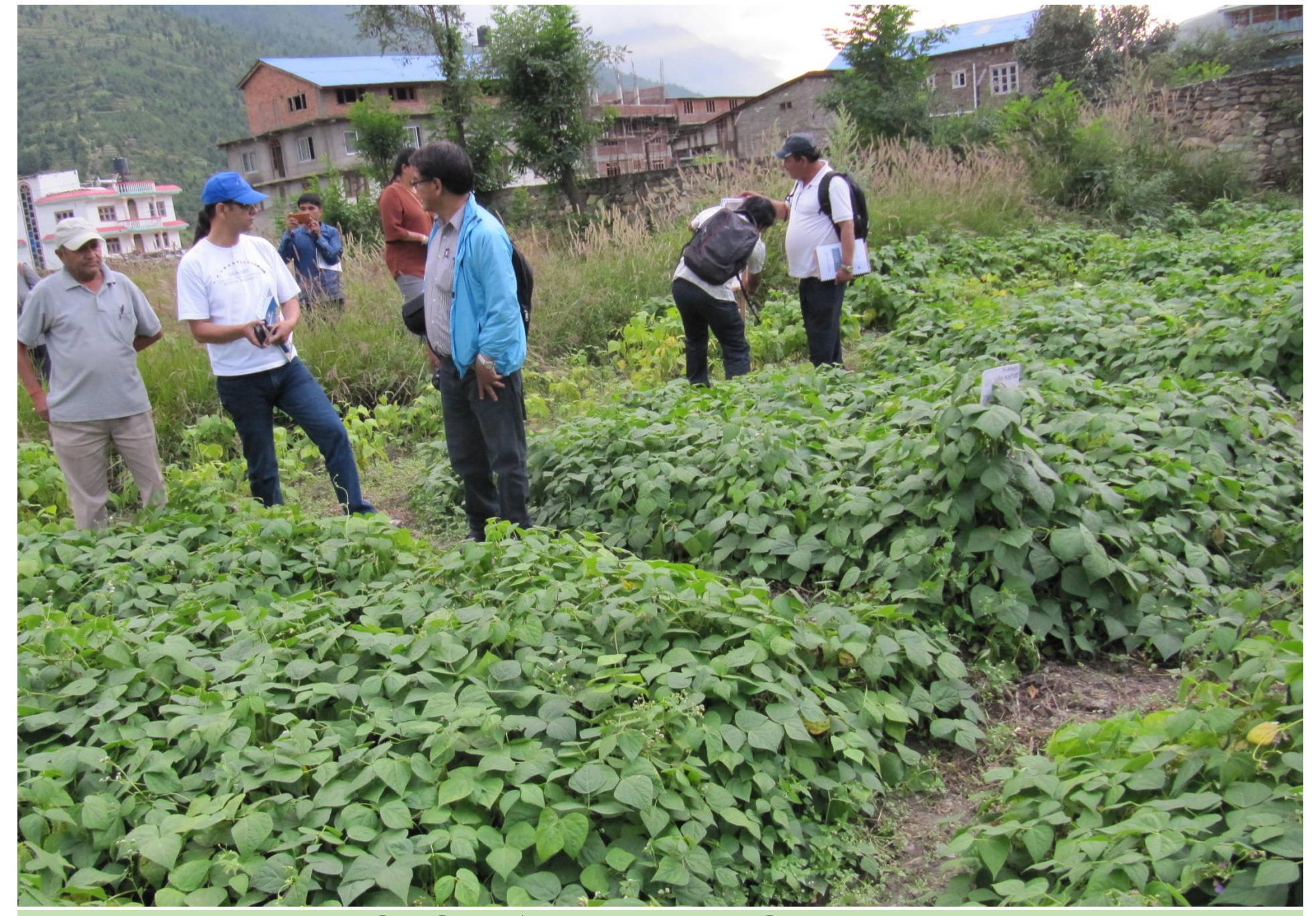
जुम्लामा सिमिको जातीय मिश्रण अनुसन्धान