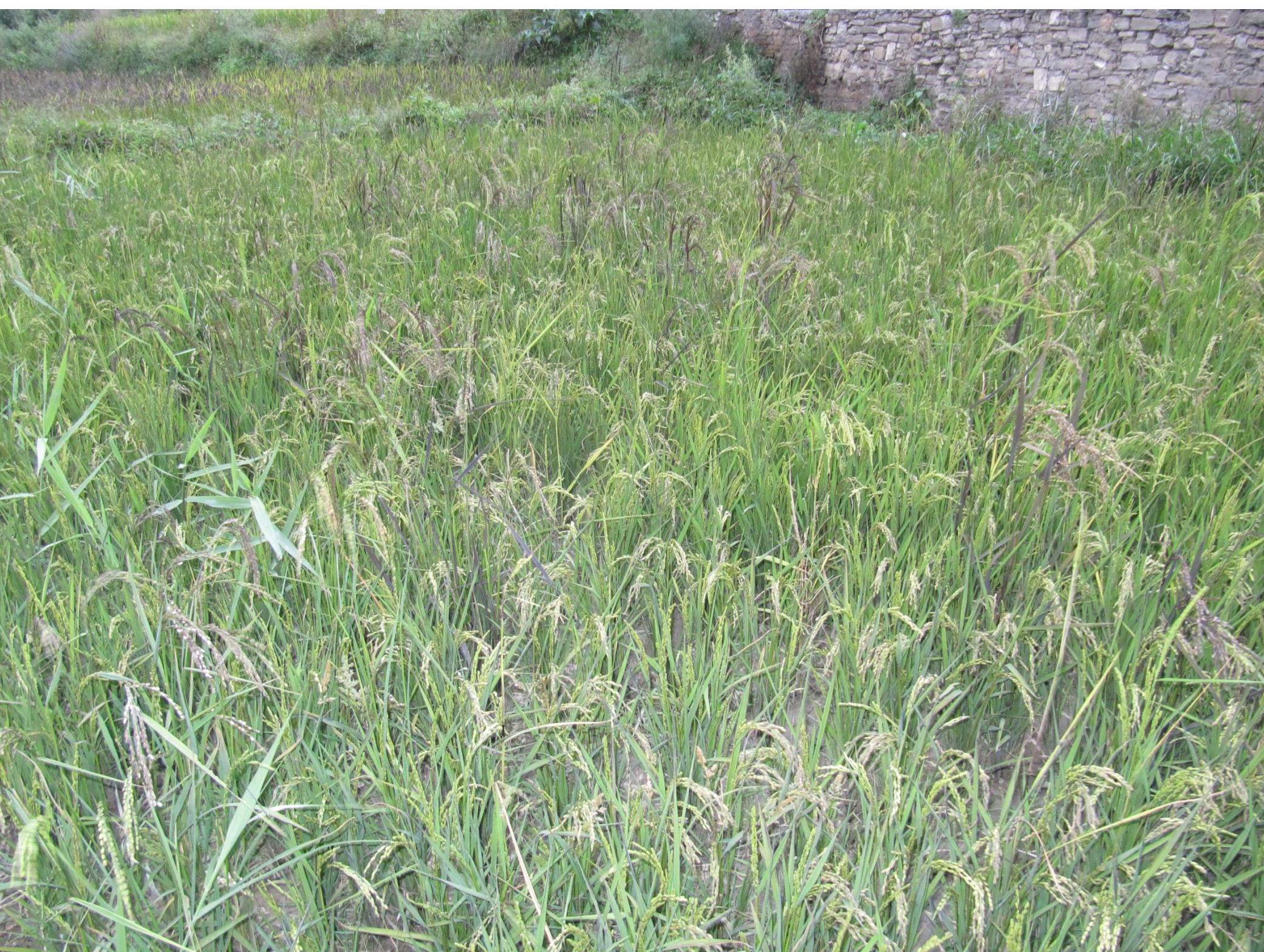
जुम्लामा धानको जातीय मिश्रण